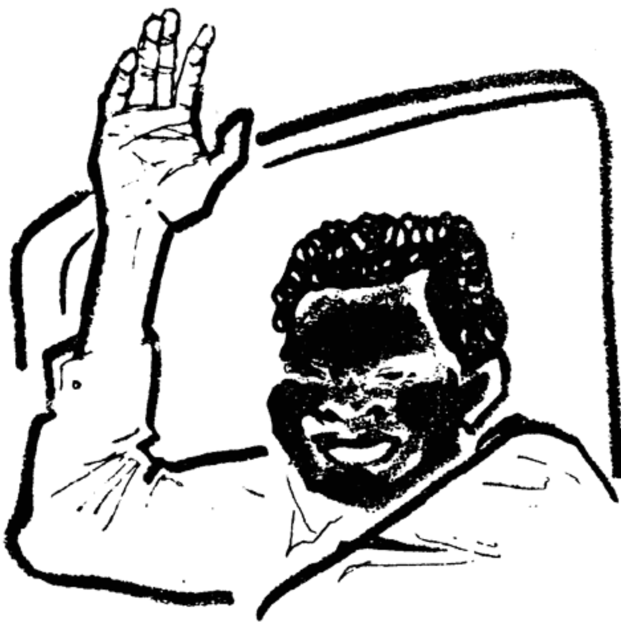
К концу дня у него еще хватало сил отвечать на приветствия...

...Москва одета в праздничный наряд, символизирующий мир, радость. Гости приветствуют улицы, широкие аллеи и площади, чудесно украшенные цветными флажками, обложками голубой и лампочек, превращающими ночь Москвы в праздник. Зрелище незабываемо. Прием, оказанный нам, не носит официального характера: гостей встречают все москвичи. В день открытия фестиваля и в последующие дни везде можно было видеть сотни людей, несущих букеты цветов или свою самую лучшую улыбку. Встреча молодежи с писателями прошла в той обстановке взаимопонимания и дружбы, в которой проходит VI фестиваль.