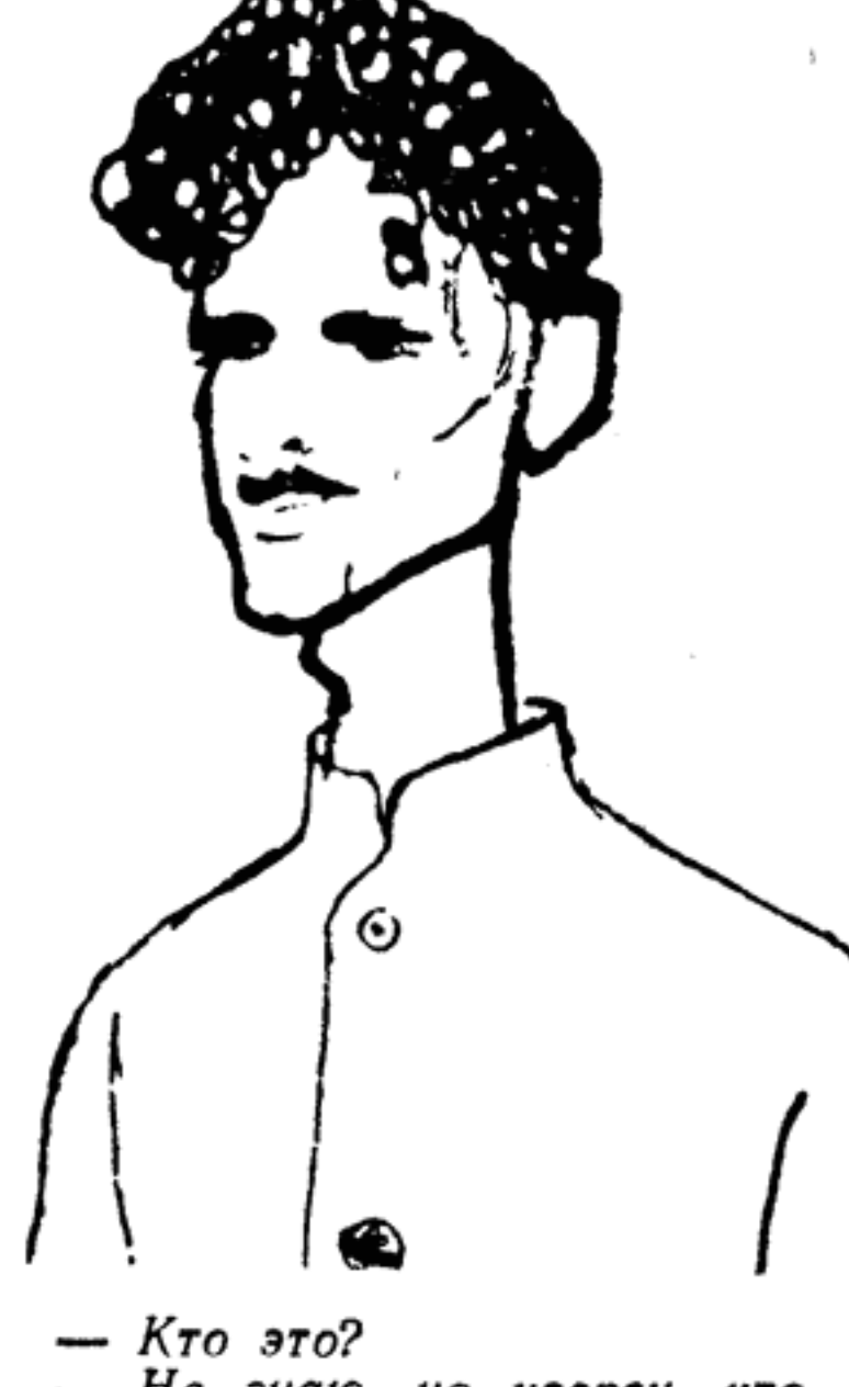
— Кто это? — Не знаю, но уверен, что друг.