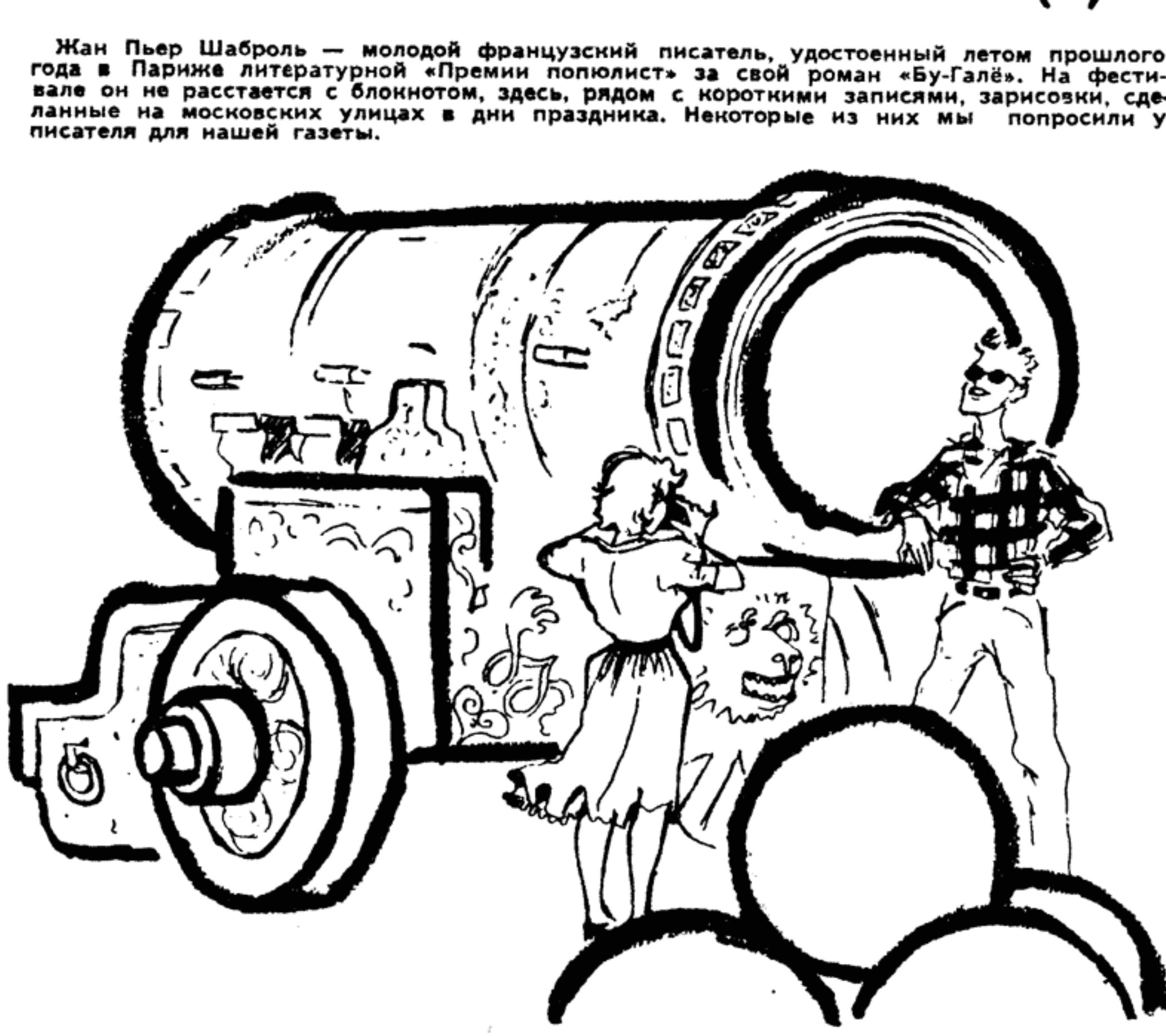
Американцы в Кремле